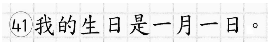
Рис.16. Образец написания иероглифических знаков

Бланк ответов № 2 (лист 1 и лист 2) по китайскому языку (рис. 14 и рис. 15) предназначен для записи ответов на задания КИМ для проведения ЕГЭ с развернутым ответом по китайскому языку (строго в соответствии с требованиями инструкции к КИМ для проведения ЕГЭ и к отдельным заданиям КИМ). Каждый иероглифический знак и каждый знак препинания следует писать внутри отдельной клетки в поле ответов бланка ответов № 2 (дополнительного бланка ответов № 2) (рис. 16).